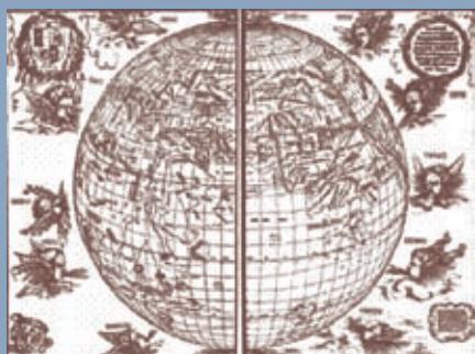
Obr. 13 Albrecht Dürer – Die Weltkarte des Johannes Stabius, 1515, dřevoryt