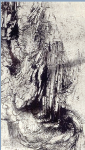
Obr. 14 Vinciho studie povrchové geologické struktury