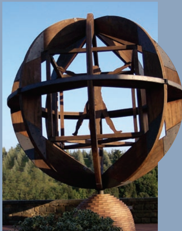
Obr. 15 Vinciho monument v rodišti Leonarda